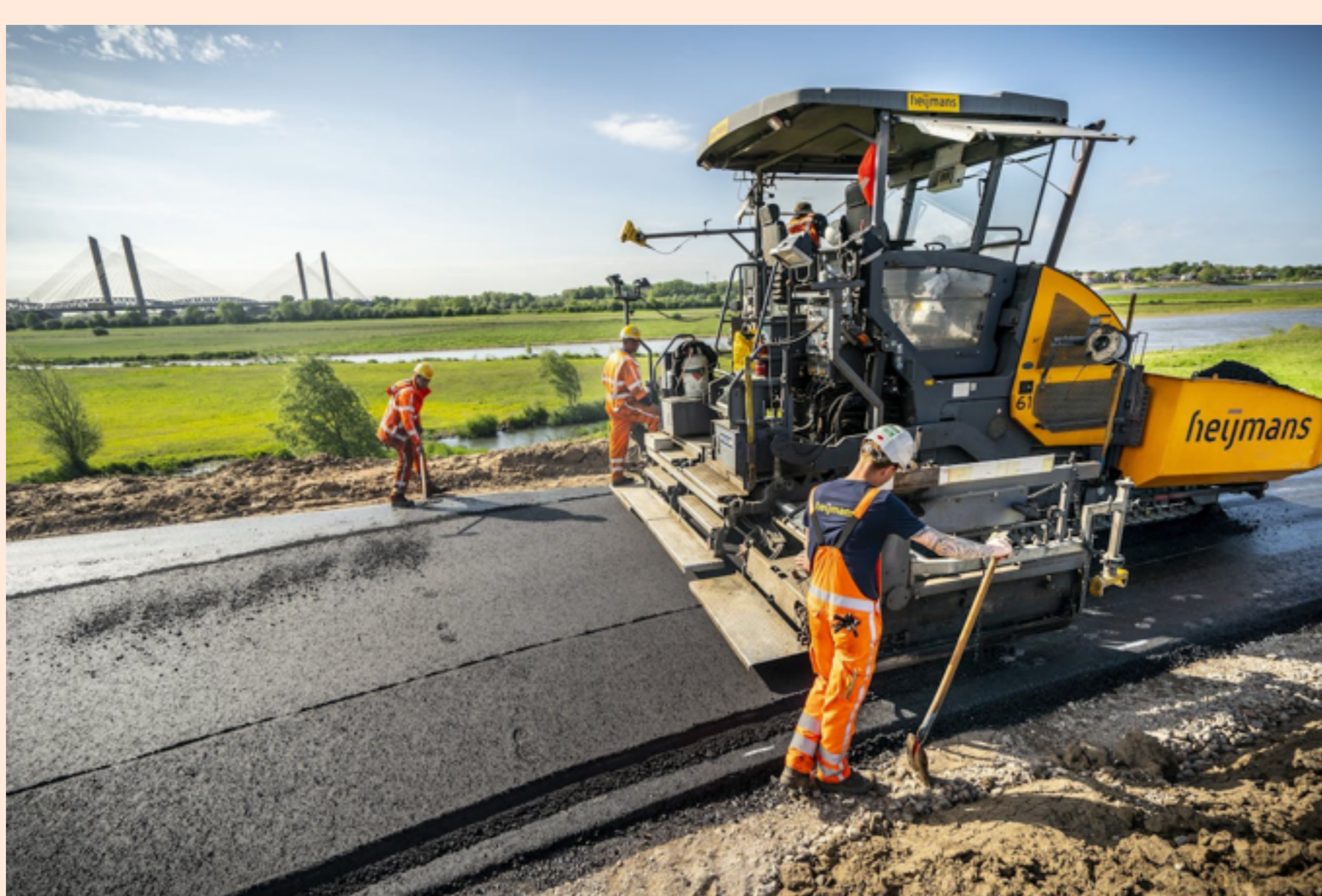
Werk aan de weg bij Waardenburg. Bouwbedrijf Heijmans wil het storten van asfalt geheel emissievrij maken.